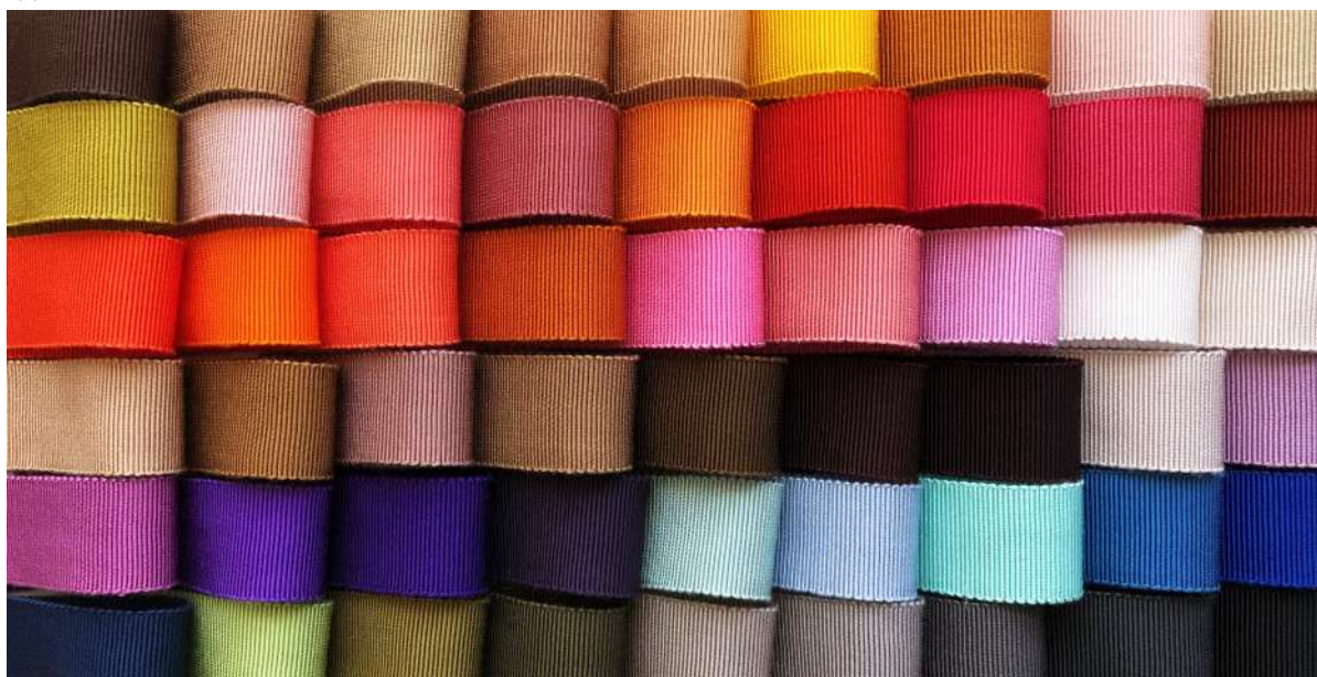
201 COLOR SAMPLES